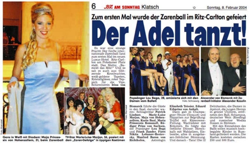
Abb. 3.3.: Der Adel tanzt! Die Armen hängen rum und sind kriminell. In: B.Z. 8.2.2004.

Die mächtigste Kategorie des Sozialstrukturatlases ist der „Sozialindex“ genannte erste Faktor, der eine „günstige“ Sozialstruktur von „ungünstigen“ unterschieden soll. „Ungünstige Sozialstruktur“ korreliert stark mit einem hohen Anteil von Personen ohne Schulabschluss, Männern, Sozialhilfeempfängern und Arbeitslosen, mit Phäno-