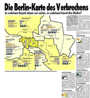
Abb. 3.1.: Verbrechens-Karte aus Berlin, in: B.Z. vom 25.11.1999.

wie Moral, Gesundheit und Fragen der städtischen Form zu den Schlüsselbegriffen der Definition von Territorien werden und die Trennlinie zwischen Pathologisierung und Kriminalisierung der Armen auf der einen und Konsolidierung bürgerlicher Identität auf der anderen Seite bestimmen. Der Slum wird von der bürgerlichen Imagination auf verschiedene Weise mit Sinn erfüllt: Konservative fanden im Slum Anknüpfungspunkte für zivilisationskritische, großstadtfeindliche Ansichten, Reformen für eine paternalistische Politik der Kontrolle gegenüber der Arbeiterklasse. Und unterhaltend war der Slum auch: Worthy citizens gaben sich lascivious inspections hin und das slumming - Exkursionen in die Slumgebiete - wurde populär. Obwohl es sich somit kaum um eine streng abgegrenzte Welt handelte, diente der Slum als ausgegrenztes Territorium zur Affirmation seines Gegenteils, der modernen, legitimen Stadt und ebnete den Weg für Abrissprogramme, die von den Zeitungen und den politisch-ökonomischen Eliten der