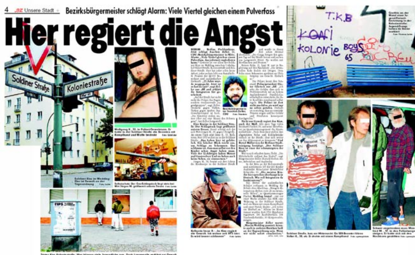
Abb. 3.2.: Hier regiert die Angst, in: B.Z.

Auch in den angewandten Wissenschaften spielt die kartografische Repräsentation von Klasse seit ihren philanthropischen Anfängen im 19. Jahrhundert eine große Rolle. Frei nach dem Konzept einer angewandten „Problemwissenschaft“ standen in der Soziologie und ihren disziplinären Nachbarinnen von Anfang die Verortung von Armut im Vordergrund. Analog zu den von Foucault beschriebenen Machttechniken zur Inventarisierung und Durchdringung des Staatsterritoriums in der Neuzeit wird der Survey zur zentralen Machttechnik zur Analyse der dunklen, verborgenen anderen Seite der Stadt (Lindner 2004). Im England der