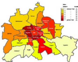
Abb. 3.5.: Statusindex auf Bezirksebene, in: Senatsverwaltung für Gesundheit und Soziales 2004: 27ff.

Dieser analytisch perfekt erscheinende Zugang zur Sozialstruktur der Stadt Berlin ist aber in vielerlei Hinsicht schwierig: Aufgrund der typischen Korrelationen der Variablen untereinander setzt beispielsweise ein hoher Ausländeranteil automatisch den Sozialindex eines Gebiets herab, während ein hoher Anteil von Hochschulabsolventen oder Alleinerziehenden den Statusindex erhöht. Die Karten des Sozialstrukturatlases stellen bei all ihrer Suggestivkraft nur einen ersten räumlichen Zugang zum Phänomen des Reichtums dar. Auch die Verortung und Kartierung eines ganzen Bündels von Indikatoren liefert keinen ausreichenden Zugang zu Sozialgeographien des Reichtums. Im folgenden Kapitel soll auf eher qualitative Zugänge aus dem Feld der Stadtforschung eingegangen werden.